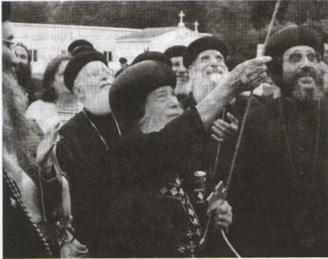
قداسة البابا يرفع علم السيمنار في كرمة العذراء ببوسطن

الرب يديم لنا وعلينا حياة وقيام أبينا الطوباي المكرم البابا المعظم الأنبا شنوده الثالث، ويحفظه للكنيسة راعياً أميناً ومديراً حكيماً.. يقود دفتها بسلام الله إلى منتهى الأعوام.. لإلهنا المجد الدائم إلى الأبد آمين.